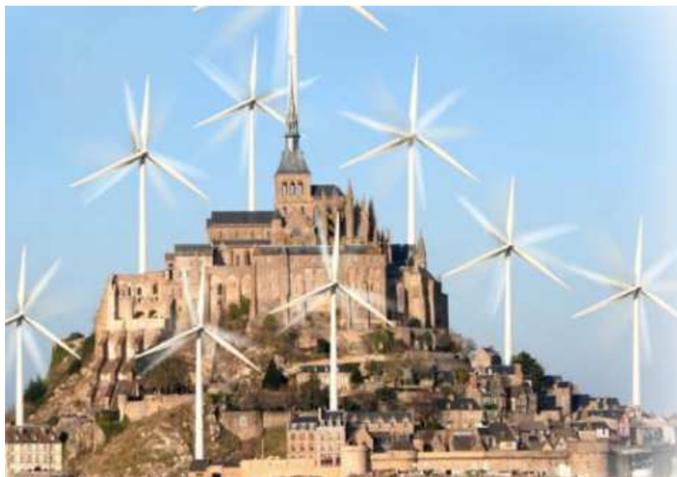
Photomontage de SOS Mont Saint-Michel

Cette illustration n'est qu'un photomontage, une simple affiche pour attirer le regard. Mais elle en dit long sur la colère d'une cascade d'associations de défense de l'environnement, qui ont décidé d'organiser samedi 26 septembre au Mont-Saint-Michel une marche internationale pour protester contre l'implantation à proximité du site historique, l'un des plus visités au monde, de plusieurs éoliennes industrielles.